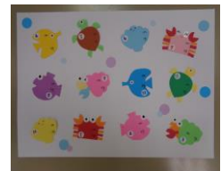
しんたいそくてい 身体測定カード